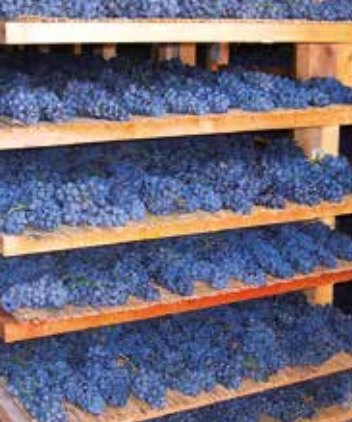
Trauben zur Trocknung im «Frutaio»