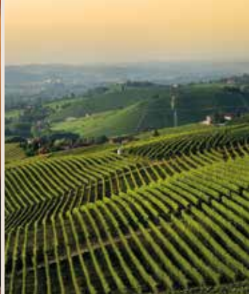
Crème de la Crème in Sachen Barbaresco-Winzer: la famiglia Sottimano.